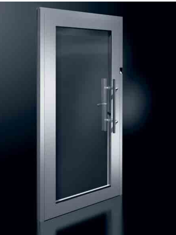
Schüco Multifunktionstür Schüco multipurpose door