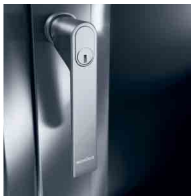
Schüco Fenstergriff, abschließbar Schüco window handle, lockable

A key feature of the system solutions for added security: the external look of the Schüco design ranges is retained because the protection mechanisms are integrated predominantly inside the units. Every structure can be equipped with optimum security for any requirements.