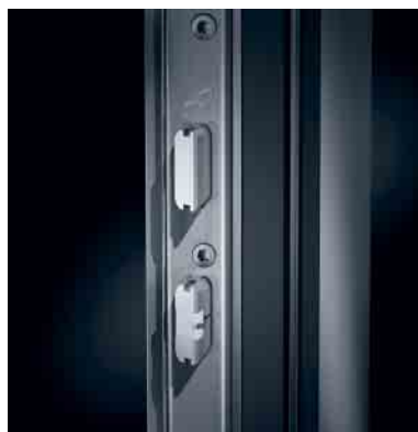
Schüco SafeMatic Automatikschloss Schüco SafeMatic automatic lock