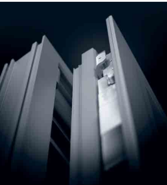
Schüco Fenster AWS mit Schüco TipTronic Beschlag (WK2) Schüco Window AWS with Schüco TipTronic fitting (WK2)