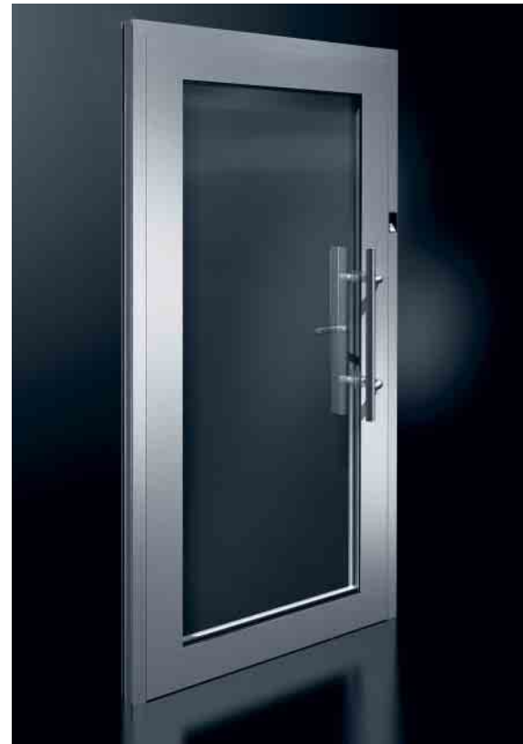
Schüco Multifunktionstür Schüco multipurpose door

Schüco safety glass Protect (optionally available with VdS-approved alarm system) offers maximum efficiency against burglary and vandalism thanks to an optimum combination of glass thickness and pane construction. Light penetration, visibility and transparency are retained so that design and functionality requirements are also fulfilled.