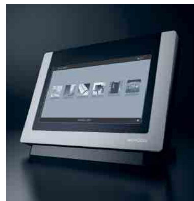
Schüco ControlPanel mit Anzeigemöglichkeit für die VdS-Öffnungs- und Verschlussüberwachungssensoren Schüco ControlPanel with display option for VdS opening and closing monitoring sensors