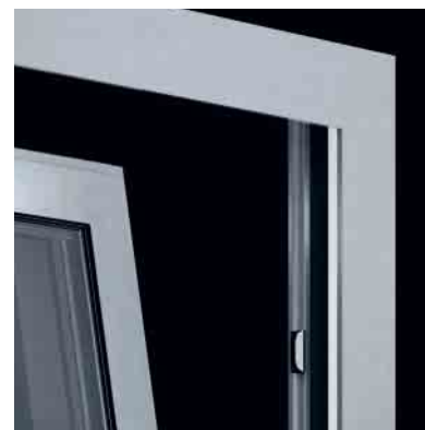
Schüco Magnetschalter Schüco magnetic switches